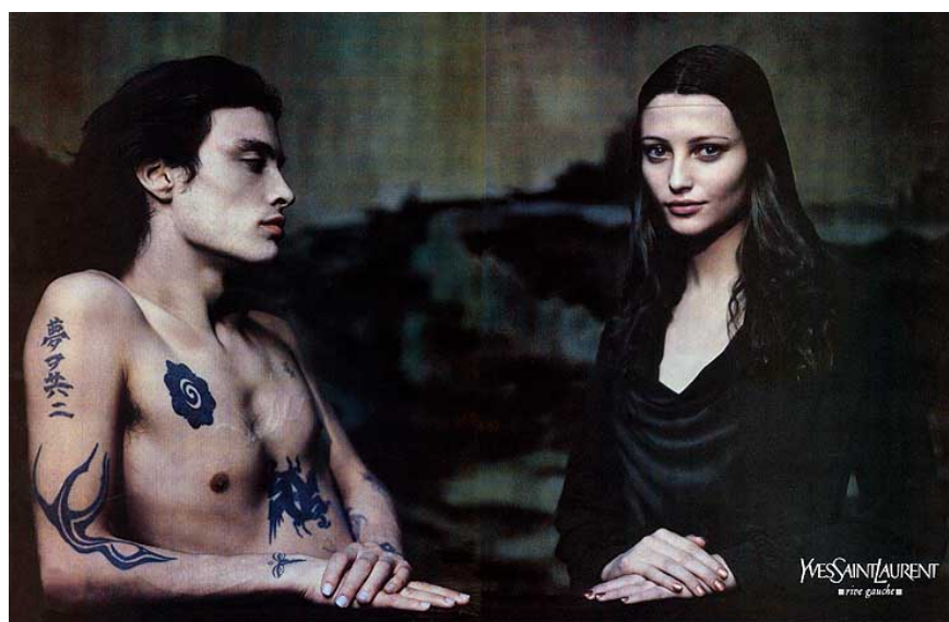
圖六 重新詮釋〈蒙娜麗莎的微笑〉

他也由許多廣告目錄和攝影中表達了他對藝術的構思，他常將畫中男女角色對換，彰顯女性角色可以藉由服裝獲得解脫及自由，1999年的春夏季廣告目錄中，他挑選了以下這五幅畫作：〈蒙娜麗莎的微笑〉（圖六）、〈浴女〉（圖七）、〈懺悔者瑪德蓮娜〉、〈海邊男子〉（圖八）及〈三位女神〉，以攝影方式重現名畫景象來呈現廣告形象。