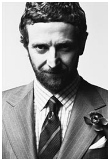
圖十三 http://www.myspace.com/richmondtan 現任 YSL 設計師 Stefano Pilati