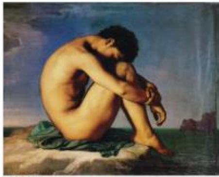
圖九 http://www.johncoulthart.com/feuilleton/the-recurrent-pose-archive/ Hippolyte Flandrin 〈海邊男子〉原圖