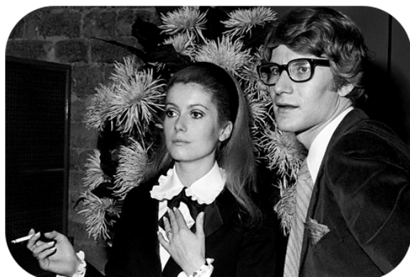
1966 年凱薩琳丹妮芙與聖羅蘭合影

如同紀凡希之於奧黛麗赫本，設計師都會有他們作為靈感激發的謬思對象，而法國女星凱薩琳丹妮芙可以說是聖羅蘭的謬思之一，他為她拍攝電影所設計的衣服，不只讓影迷對演技留下深刻的映象，也讓他們深深的被服裝的美吸引。