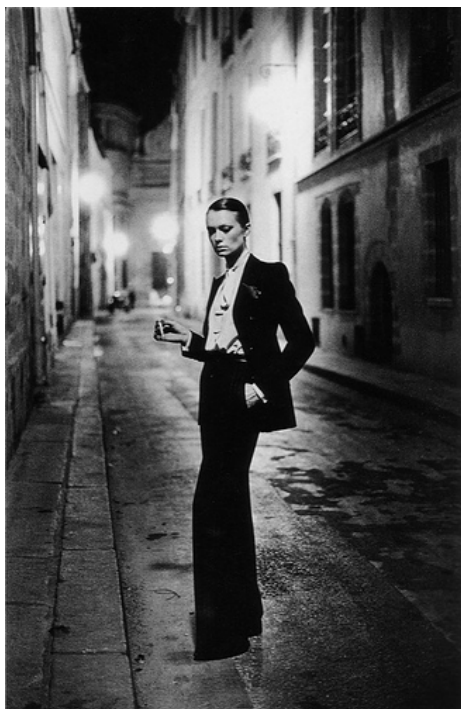
圖四 1966 年推出的 le smoking 系列

香奈兒女士替女性設計了褲裝、以男性服裝為元素的寬鬆上衣，讓女性拋棄束腹，是二十世紀初期女性對自由、解放的追求，但卻只侷限於居家休閒時穿著。而聖羅蘭在 1966 年推出的 smoking suit (圖四) 和 Tuxedo 系列，將男裝的晚禮服型式套用至女裝，讓女性能穿著出席正式場合和晚宴。