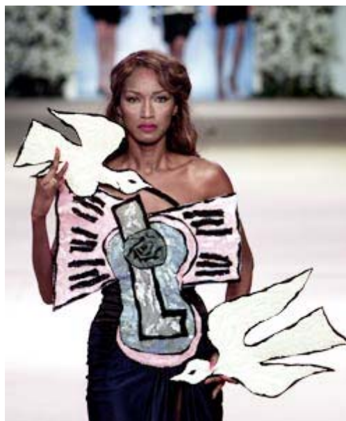
圖五 模擬畢卡索的立體主義畫作

http://cyc.blox.pl/2008/06/Pamieci-Yves-Saint-Laurenta.html