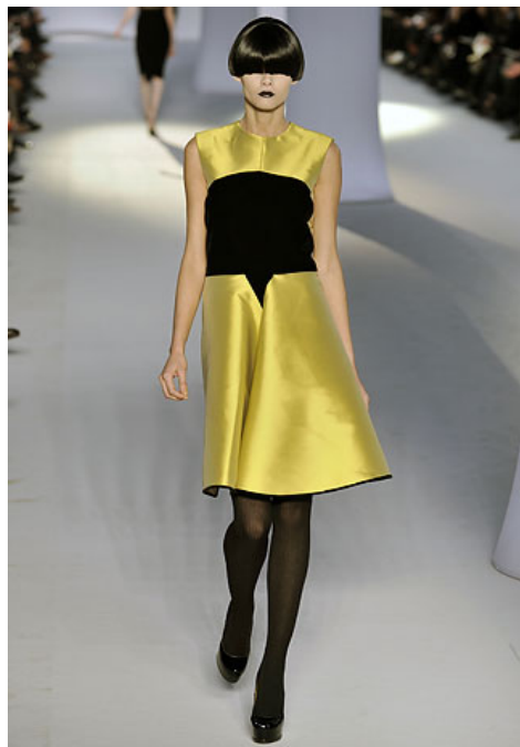
圖十二 www.style.com 2008A/W ready-to-wear

1966 年聖羅蘭推出成衣系列與開設專賣店，許多設計師也紛紛成立，有些甚至致力於量產的成衣，而不再是高級訂製服。這個舉動也改變了時裝界的行銷制度。Rive Gauche 在法文中就是河左岸，左岸代表自由、充滿實驗性的區域，而這也是聖羅蘭所渴望表達的精神。